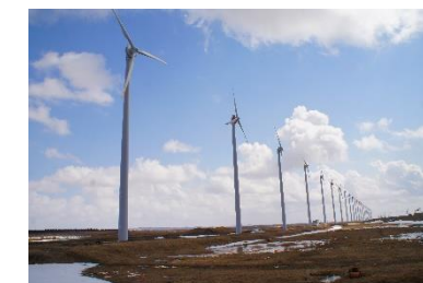
オトソルイ風力発電所