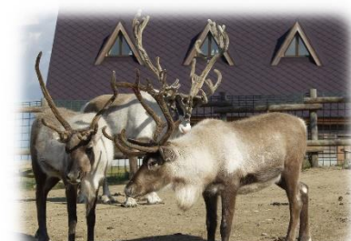
トナカイ観光牧場