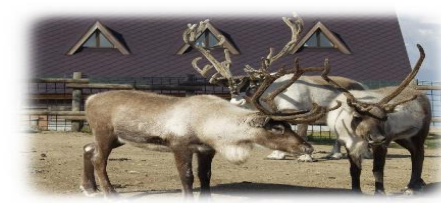
トナカイ観光牧場