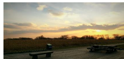
サロベツ湿原センター